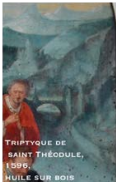
TRIPTYQUE DE SAINT THÉODULE, 1596, HUILE SUR BOIS