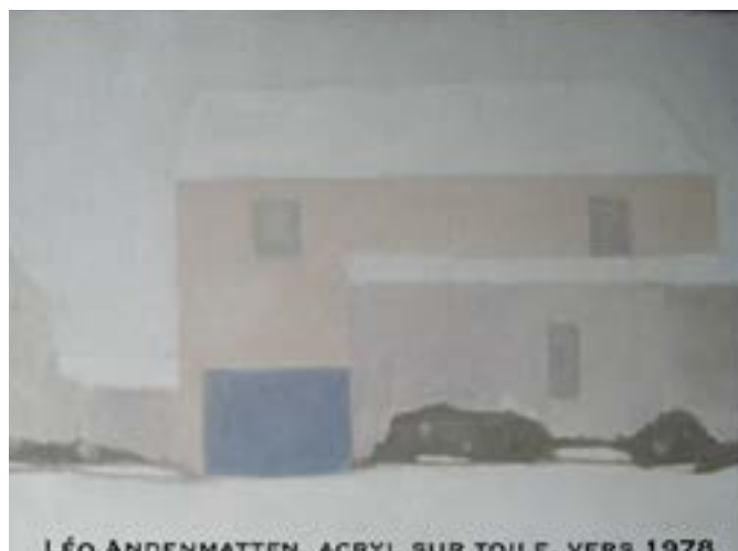
LÉO ANDENMATTEN, ACRYL SUR TOILE, VERS 1978