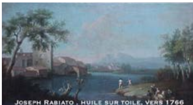
JOSEPH RABIATO , HUILE SUR TOILE, VERS 1766