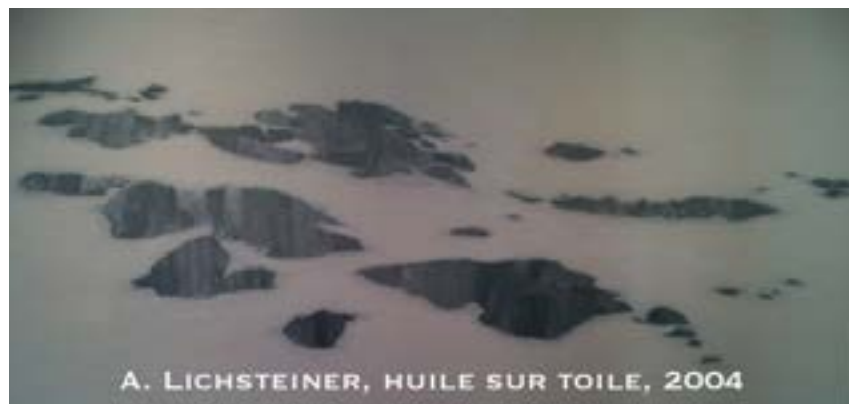
A. LICHSTEINER, HUILE SUR TOILE, 2004